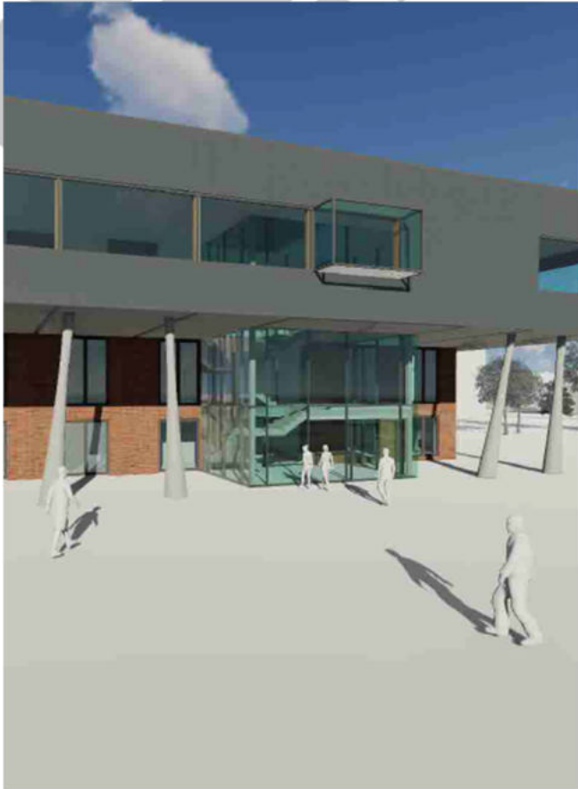
Grafik: Thalen Consult GmbH

Aktuell wird die Feinplanung für den Bürgerhaus-Umbau unter Einbezug der jeweiligen Einrichtungsleitungen finalisiert. Im Frühjahr 2025 beginnen die Umbaumaßnahmen und werden vsl. bis Mitte 2027 abgeschlossen sein.