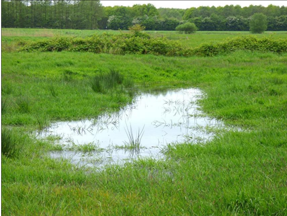
Abb. 3: Kleingewässer im Nordwesten des Untersuchungsgebiets im Mai 2014

Das gesamte Gewässersystem ist größtenteils voll besonnt; nur lokal werden einzelne Bereiche durch Gehölze/Gebüsche am Ufer beschattet.