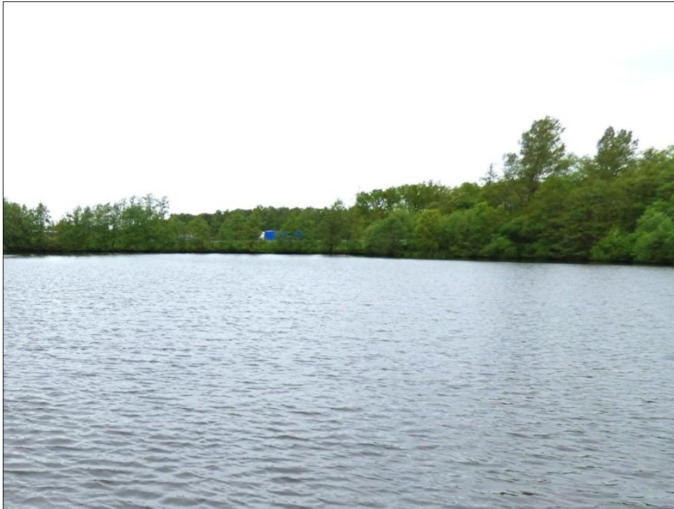
Abb. 5: Nördlicher Teil des Sandentnahmewässers im Mai 2014