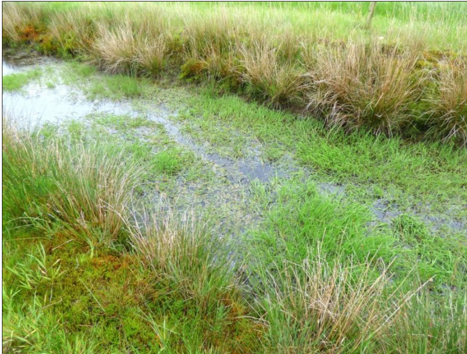
Abb. 2: Stark verwachsener Grabenabschnitt im Nordwesten des Untersuchungsgebiets im Mai 2014

den Grabenabschnitte befinden sich zumeist auf moorigem/torfigem Untergrund und weisen im Vergleich zum südlichen Grabensystem teilweise eine bessere Wasserführung auf.