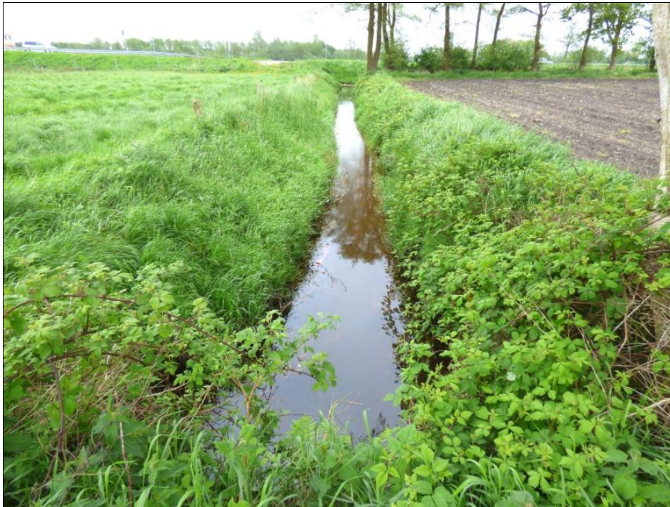
Abb. 1: Grabenabschnitt im Südosten des Untersuchungsgebiets im Mai 2014

Die Gewässerabschnitte im Südosten sind größtenteils relativ arm an Wasservegetation und weisen häufig mehr oder weniger tief eingeschnittene V- bzw. Trapez-Profile auf (Abb. 1). Die Wasserführung im Zeitraum der Amphibienerfassungen war in diesem Bereich überwiegend gering (zumeist 10-20 cm).