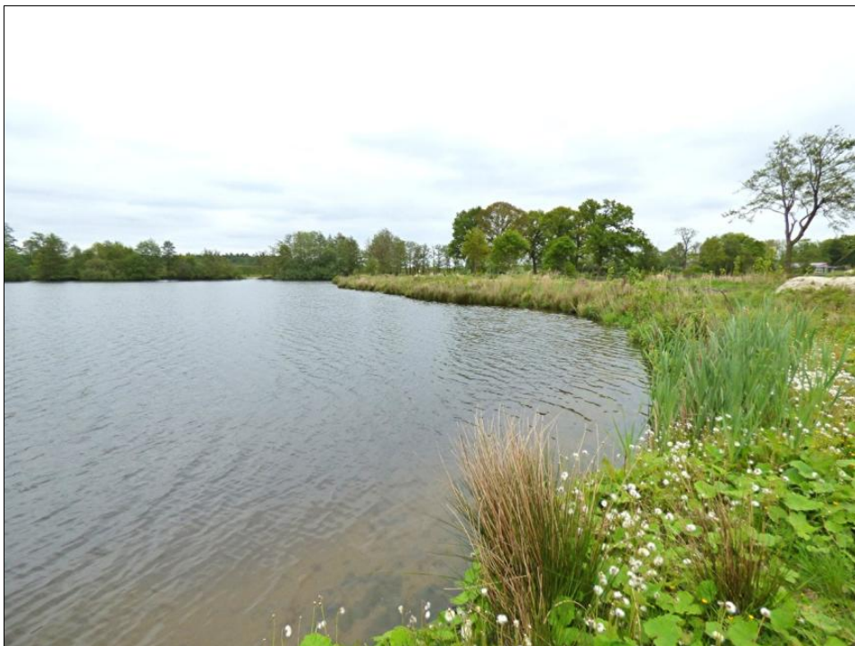
Abb. 4: Südlicher Teil des Sandentnahmewässers im Mai 2014

Bewertung: Auf Grundlage der aktuellen Amphibiennachweise ergibt sich für das Sandabbaugewässer eine geringe bis eingeschränkte Bedeutung . Wie bereits hinsichtlich des Grabensystems angemerkt, begründet sich der sehr geringe Umfang der aktuellen Amphibiennachweise möglicherweise u.a. aus den durchgeführten Umsiedlungsmaßnahmen. Allerdings erscheint ebenso die aktuelle Ausprägung des Gewässers mit teilweise starkem Wellenschlag, steilen Abbruchkanten und dichten Gehölzbeständen an den Ufern sowie dem weitgehenden Fehlen von Wasservegetation für viele Amphibienarten als nicht optimal. Die genannten Habitatfaktoren könnten somit ebenfalls für die geringen Arten- und Individuenzahlen verantwortlich sein. Aufgrund der vorliegenden Ergebnisse ist daher nicht abschließend zu klären, ob das Sandentnahmewasser ein höheres Lebensraumpotential aufweist, als die aktuellen Amphibiennachweise nahelegen.