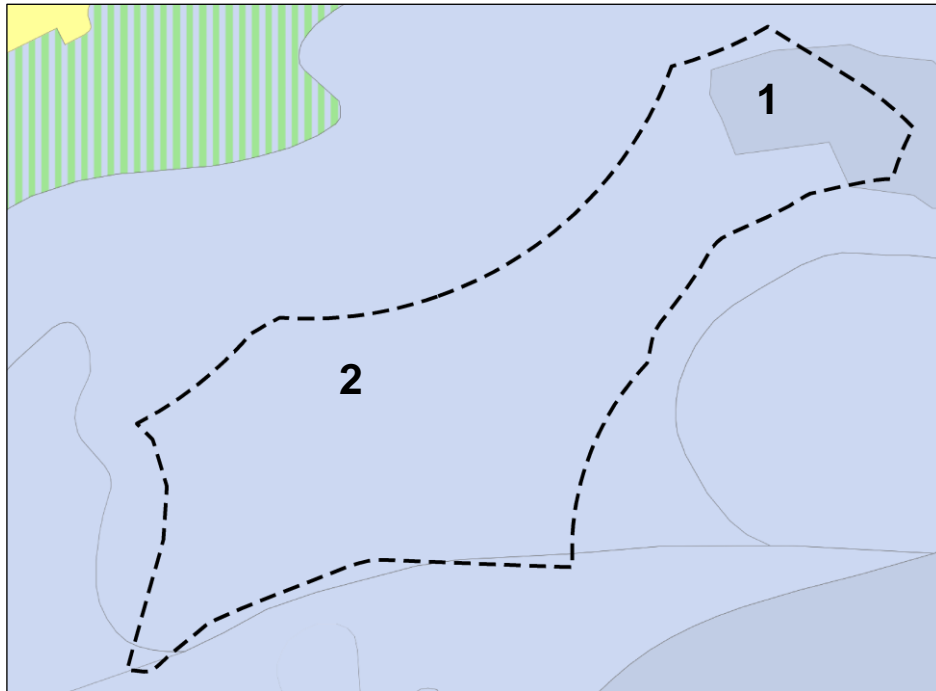
Abb. 1: Auszug aus der Bodenkarte von Niedersachsen (BK50) mit Darstellung des Teilbereichs I (schwarz gestrichelte Linie) (Quelle: https://nibis.lbeg.de/cardomap3/# , unmaßstäblich).

Der Teilbereich I „Schortens Süd“ wird durch „Tiefe Kleimarsch (1)“ sowie „Mittlere Kleimarsch“ (2) geprägt (vgl. Abb. 1).